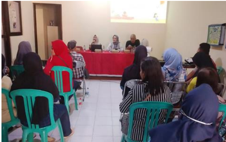
Gambar 1. Proses Penyuluhan

Materi penyuluhan difokuskan pada pemahaman terhadap beberapa instrumen hukum yang berkaitan dengan perlindungan perempuan dan anak, antara lain Undang-Undang Nomor 23 Tahun 2004 tentang Penghapusan Kekerasan Dalam Rumah Tangga, Undang-Undang Nomor 35 Tahun 2014 tentang Perlindungan Anak, serta Undang-Undang Nomor 1 Tahun 2023 tentang Kitab Undang-Undang Hukum Pidana sebagai KUHP nasional yang baru.